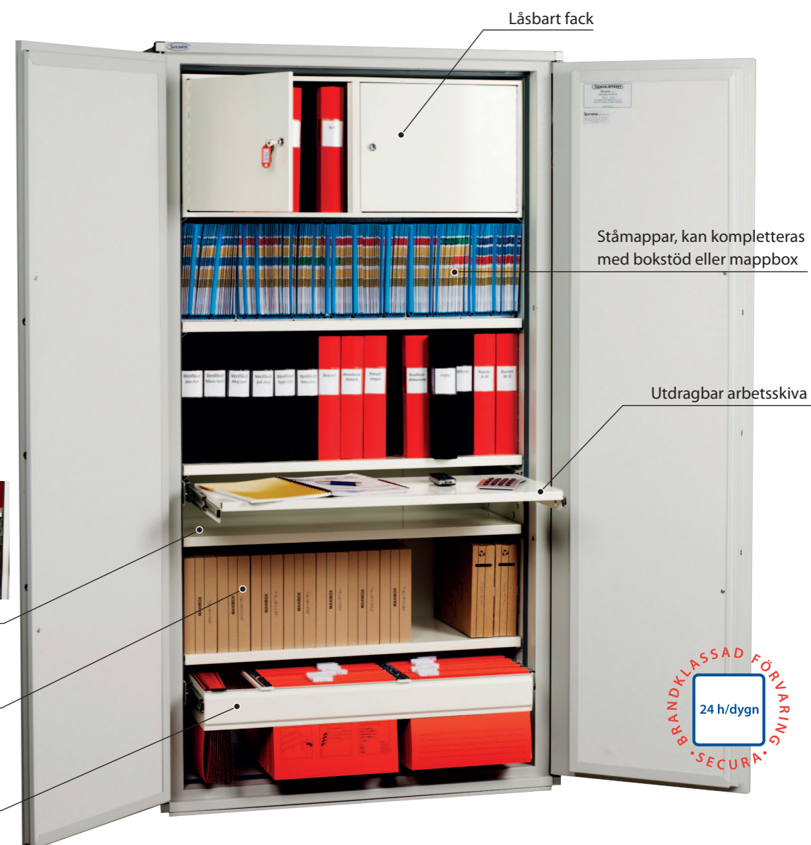
Utdragbara hängmappsramar på expansion

Våra brandsäkra skåp är naturligtvis testade och certifierade att skydda handlingar vid en total brand. Men dom är också utvecklade för att fungera som en naturlig förvaringsplats alla de dagar det inte brinner.